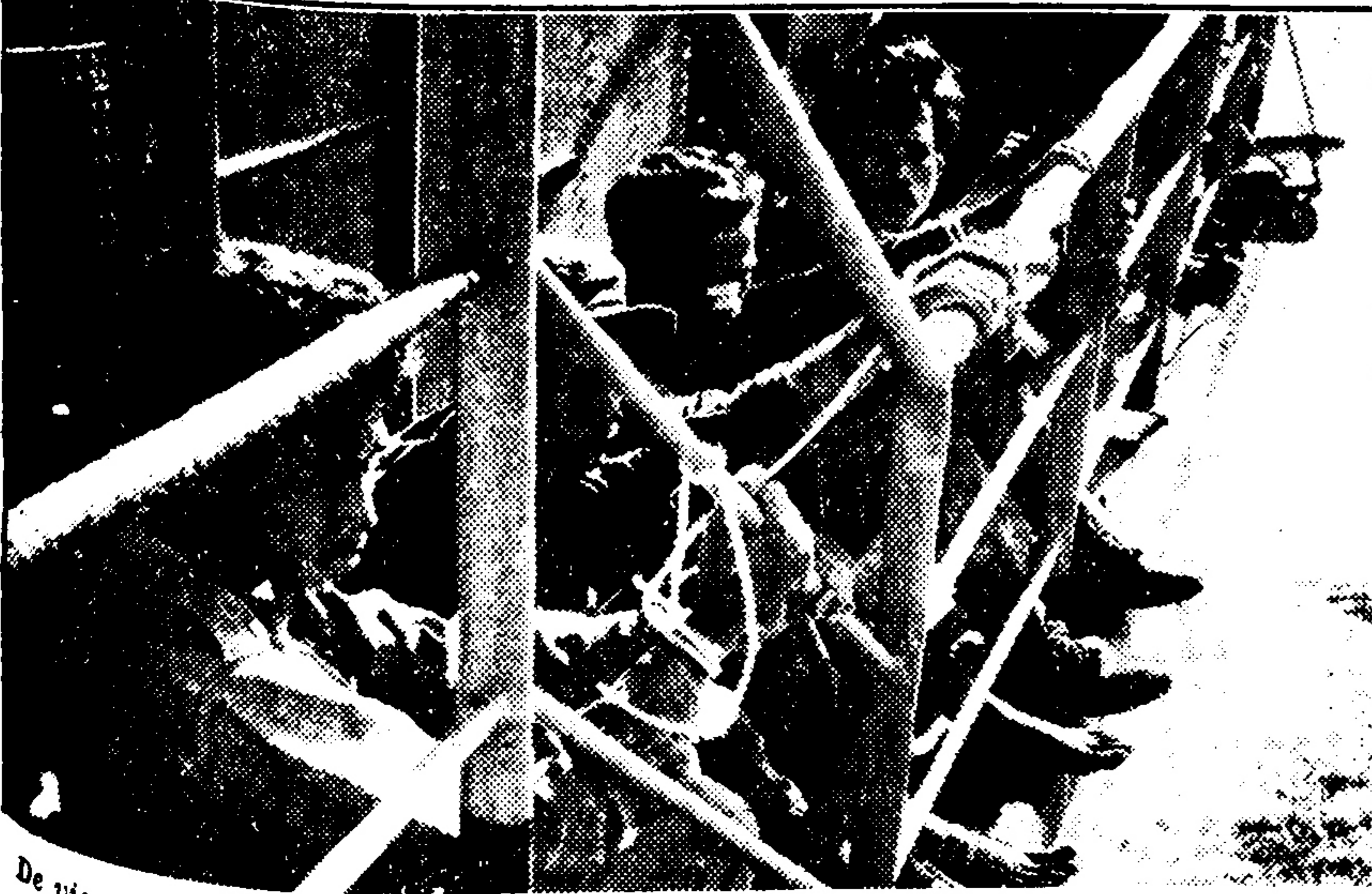
De vier gevangenen van de landmacht werden tijdens de vaart over de rivier van Teminaboean naar zee eren aan de reling vastgebonden om ontsnapping naar de oever te voorkomen. Daar konden immers collega's van de gevangenen nog rondzwerven. Direct nadat de gevarenzone was gepasseerd, werden ze weer losgemaakt.